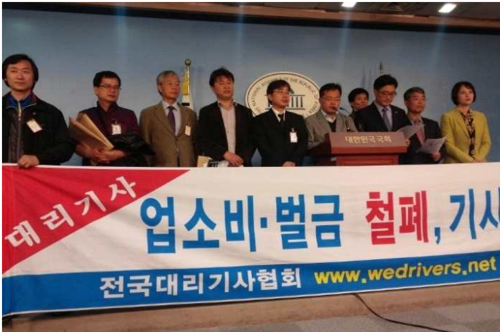
▲ 대리기사와 시민단체, 국회의원들이 함께 국회에서 기자회견을 진행하고 있다. 대리운전업법 제정, 그 과정 자체가 대리기사의 건강한 힘을 모으고 부당한 현실을 개선하는 과정이 되어야 합니다.

아무리 좋은 법이 만들어질지라도 대리기사들의 단결과 정의로운 조직이 없는 한, 죽워서 개주는 꼴이 될 수 있습니다. 자칫 업자들의 장난, 이권을 노린 지역 폭력조직의 개입, 어용조직들의 출몰 등이 판치는 한, 대리운전업법은 좋은 일 하려다 지옥가는 지름길이 될 수 있습니다.