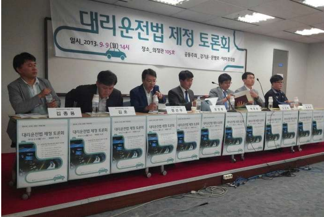
▲ 공정한 대리운전법을 위한 노력 2013년 9월9일,국회에서 대리운전법 제정토론회가 개최되었습니다. 대리운전업법에 대한 대중적 관심이 집중되었습니다.