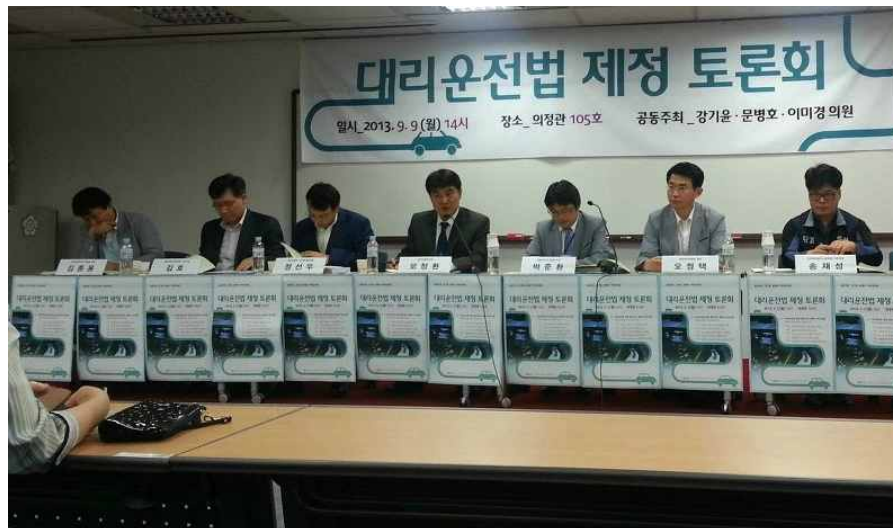
8.13일 더불어민주당의 원혜영의원이 대리운전업법을 대표발의했다. 사진은 2013년 국회에서 개최된 대리운전법 국회토론회 광경

이미 대리운전시장은 정상적 영업과 경영을 통해 먹고사는 시장이 아닌게 되 버린지 오래입니다. 고율의 수수료에 대리보험료 착복, 벌금이니 관리비니 부당이득 강요, 무도한 배차제한에 더해 이제는 기사를 더욱 옥죄이는 기사등급제까지 시행하면서, 갈수록 횡포가 극심해져만 가고 있는 것입니다. 또한 신규사업자인 카카오 역시 고율의 수수료 부과, '확정요금제' 도입을 통한 시장 교란 등, 시장의 병폐에 편승하기는 마찬가지입니다.