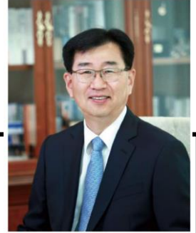
李元暉 현대자동차 주식회사 대표이사 이원희

경영철학/비전/핵심가치/CEO메시지에는 회사 전체의 비전과 미래전략방향이 담겨 있습니다.