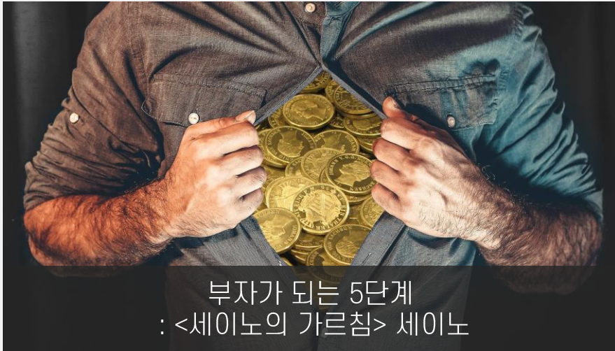
부자가 되는 5단계 : <세이노의 가르침> 세이노