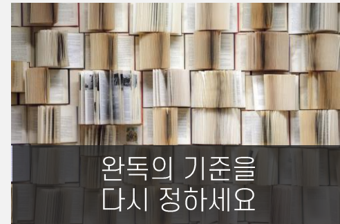
완독의 기준을 다시 정하세요