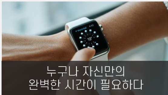
누구나 자신만의 완벽한 시간이 필요하다