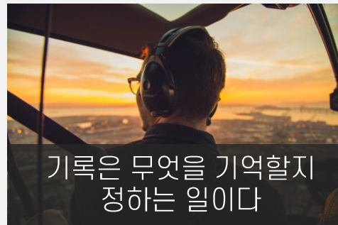
기록은 무엇을 기억할지 정하는 일이다