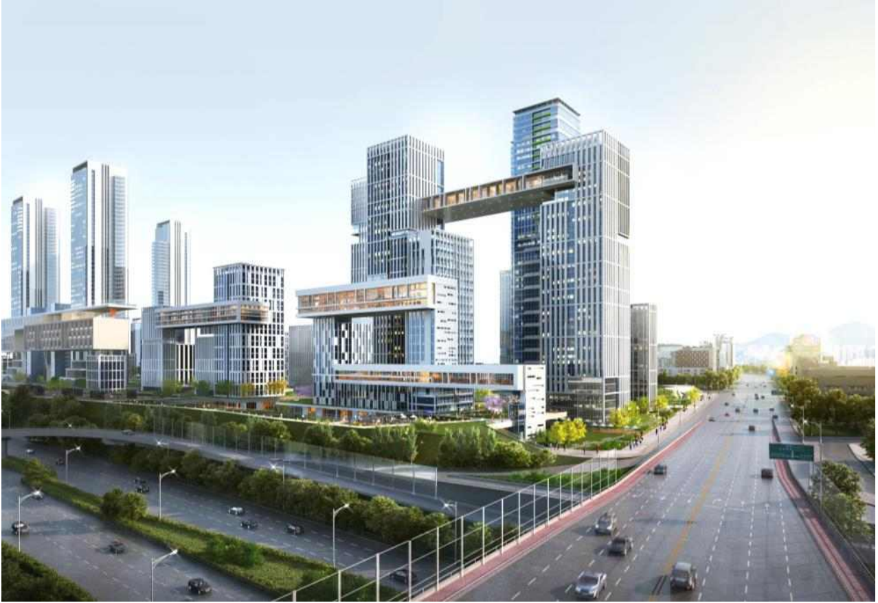
< 5구역 조감도(안) > 단지 내 중앙광장 형성 및 보이드 공간을 통한 한강조망 공유