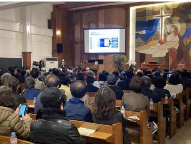
< 압구정4구역 주민설명회 >