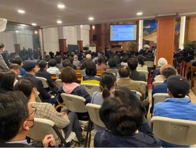
< 압구정2구역 주민설명회 >