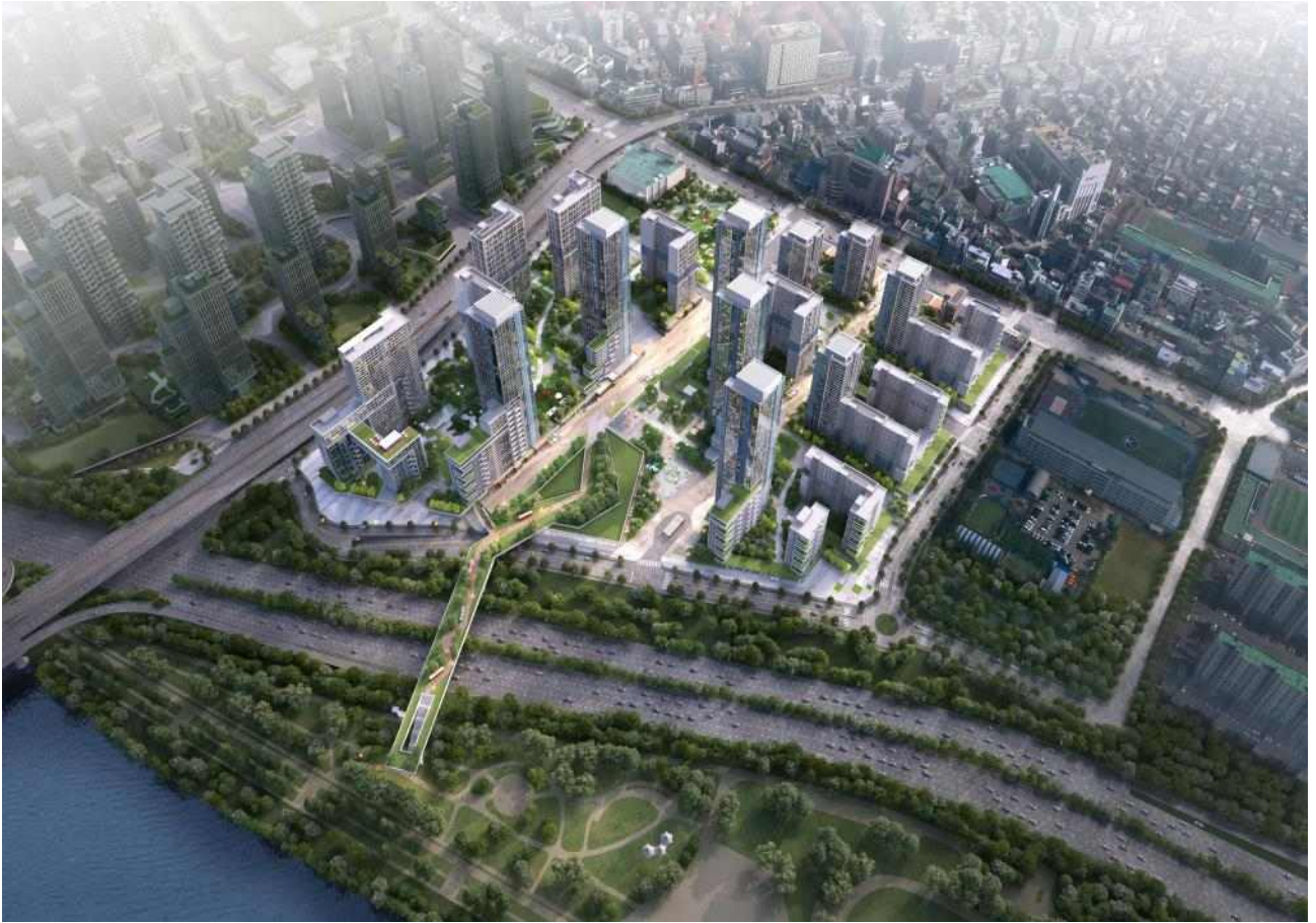
< 2구역 투시도(안) > 압구정로변 공원에서 바라본 2구역