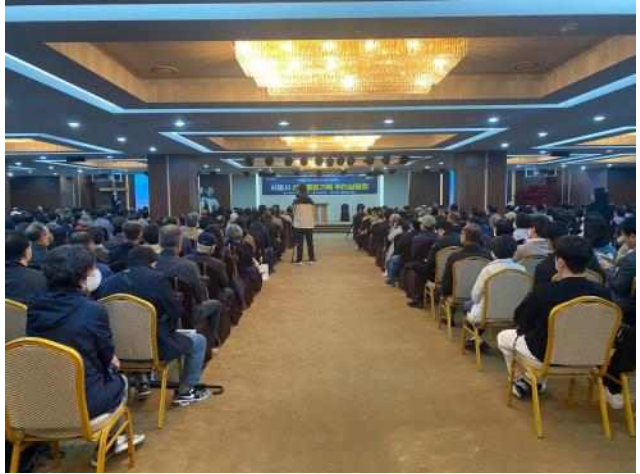
< 압구정3구역 주민설명회 >