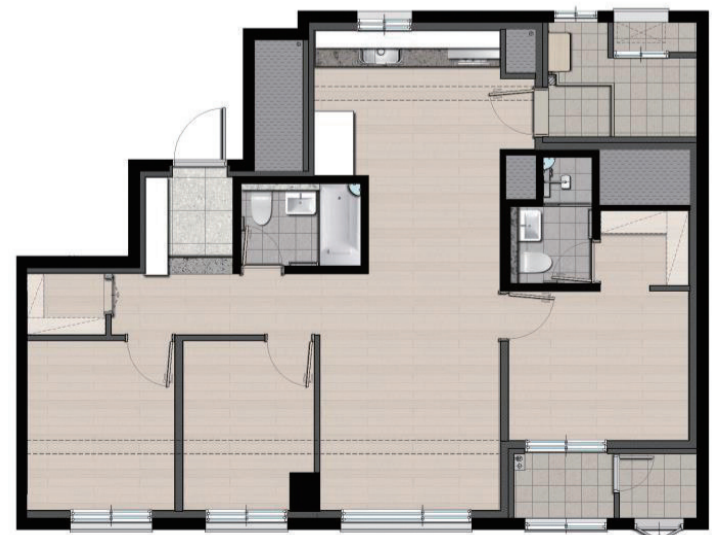
대표 주택형(59A Type)의 평면도