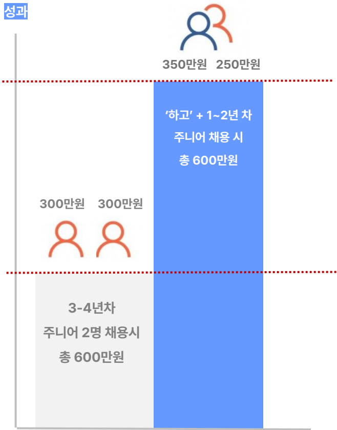
[동일 급여대비 성과]