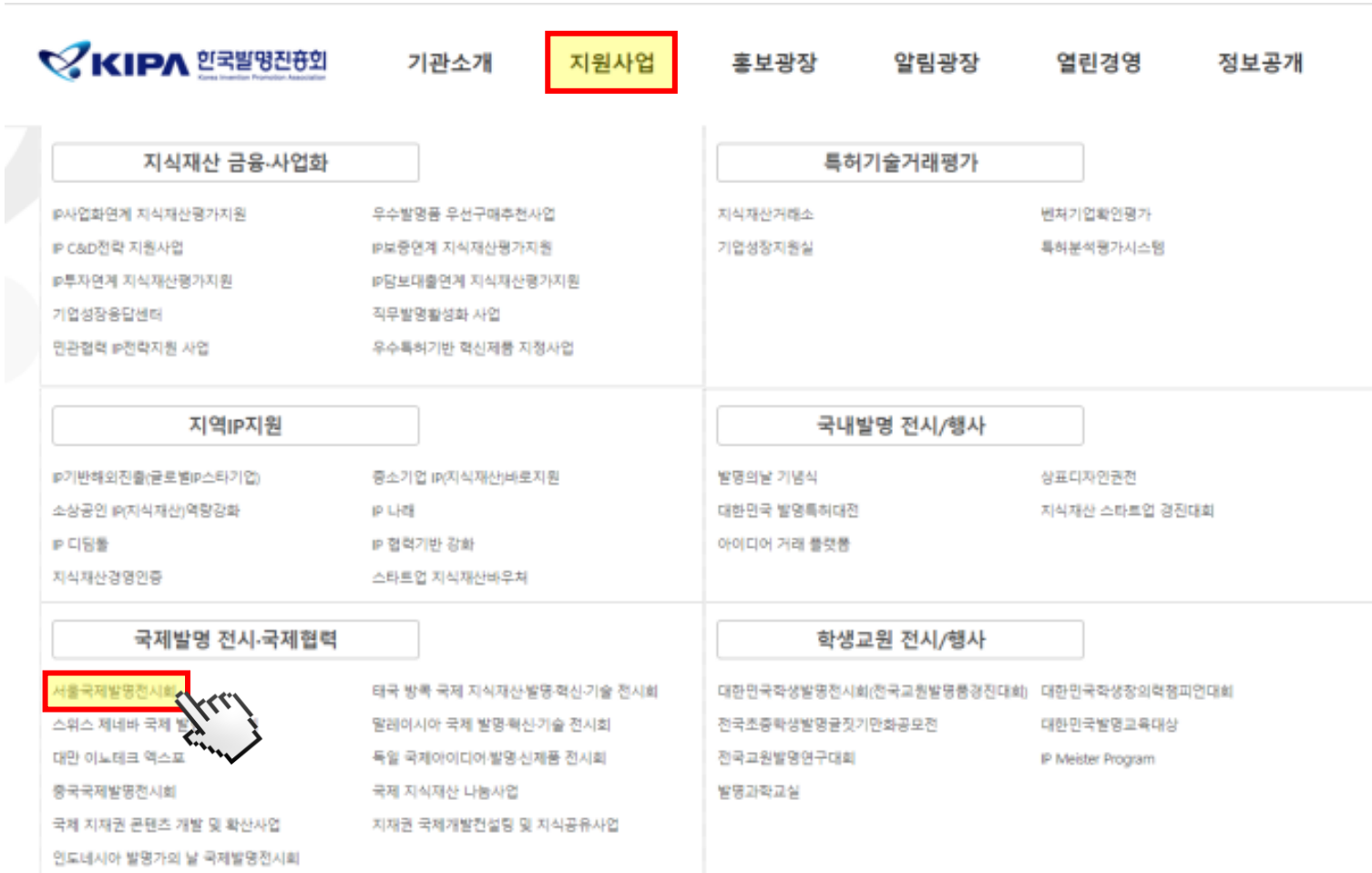
한국발명진흥회 홈페이지 내 세부 메뉴