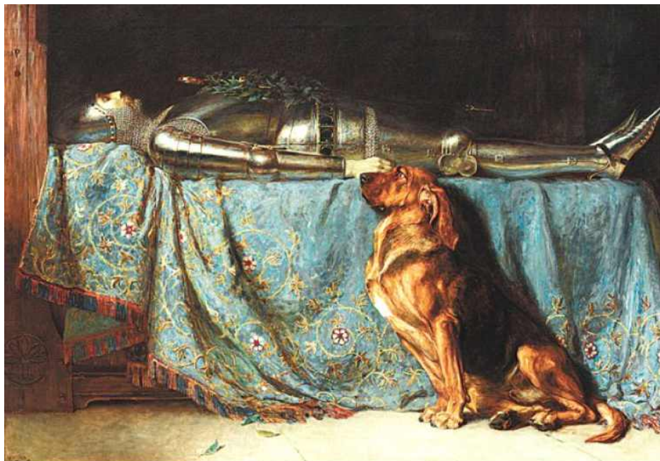
브리튼 리비에르 '망자를 위한 기도', 1888년.