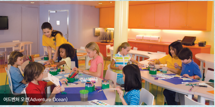
어드벤처 오션(Adventure Ocean)

오베이션호는 3세 아동부터 17세 청소년에 적합한 시설과 체계적이고 신나는 어드벤처 오션 프로그램을 갖추고 있습니다. 이들을 위한 프로그램뿐만 아니라, 만 13~17세 청소년들을 위한 닌텐도 Wii 등의 비디오 게임이나, 카드 게임을 배우는 킷 카보, 청소년만 출입할 수 있는 나이트클럽 등 어린이 프로그램이 특화되어 있어 지루할 틈이 없습니다. 또한 본 프로그램은 크루즈 요금에 포함되어 있으므로 별도의 비용 없이 참가가 가능합니다.