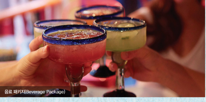
음료 패키지(Beverage Package)

[TIP] _ 고객의 위생을 위해 개별 봉투에 물, 혹은 음료를 받으실 수 있습니다. 모든 승객과 승무원들이 안전하게 깨끗한 물과 음료를 마실 수 있도록 모든 승객들의 작은 협조가 필요합니다.