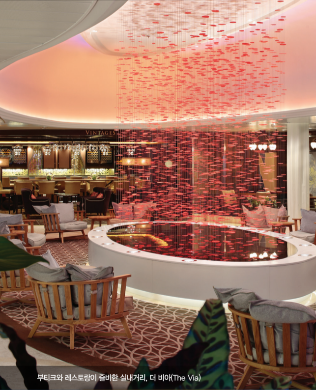
북극의 레스토랑이 준비한 샐러키, 더 비어(The Via)