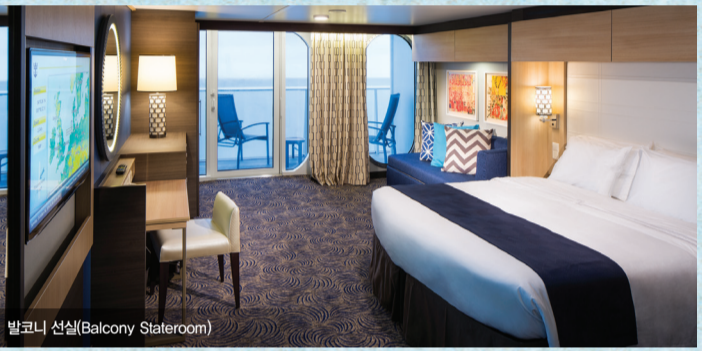
발코니 선실(Balcony Stateroom)