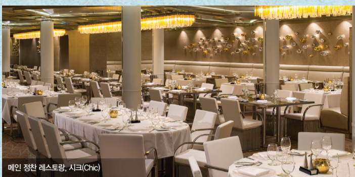
메인 정찬 레스토랑, 시크(Chic)

오베이션호의 다이닝 다이닝은 좀 더 다양하게 마련된 4개의 메인 레스토랑에서 취향에 맞는 저녁 정찬을 즐기실 수 있는 새로운 차원의 다이닝입니다. 아래의 레스토랑 중 그날의 무드 또는 개인의 기호에 맞춰 무료로 다이닝을 즐기시면 됩니다.