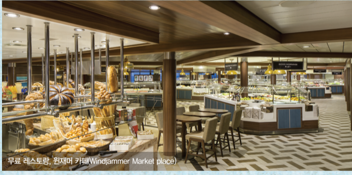
무료 레스토랑, 윈저마켓(Windjammer Market place)

■ 윈저마켓(Windjammer Market place), 뷔페 레스토랑 _ 14층 선미 (Afterward) 14층 선미에 위치한 윈저마켓 카페는 뷔페 스타일 레스토랑으로 아침, 점심, 저녁 모두 이용 가능합니다. 아침에는 다양한 베이커리, 시리얼, 우유, 주스, 쉐, 오믈렛, 소시지, 샐러드, 과일 등이 준비되어 있으며, 점심과 저녁에는 서양식과 동양식이 함께 어우러진 인터내셔널 뷔페를 즐기실 수 있습니다.