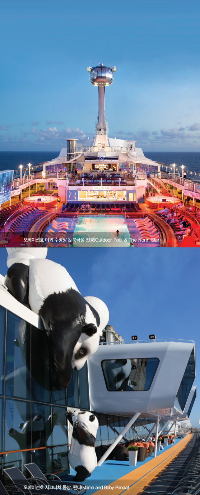
오베이션호 야외 수영장 & 북극성 전경(Outdoor Pool & The North Star)