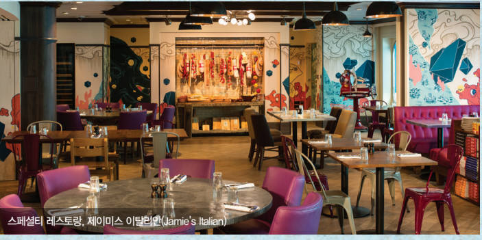
스페셜티 레스토랑, 제이미 이탈리아(Jamie's Italian)

■ 제이미 이탈리아 (Jamie's Italian) _ 5층 선미 (Afterward) 세계적으로 유명한 셰프 제이미 올리버의 음식들을 만나실 수 있는 좋은 기회입니다. 각종 신선한 해산물과 과일, 재료들을 이용한 퓨전 이탈리아 요리들을 맛보실 수 있습니다. (런치 $25 / 디너 $35)