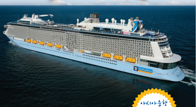
Royal Caribbean INTERNATIONAL