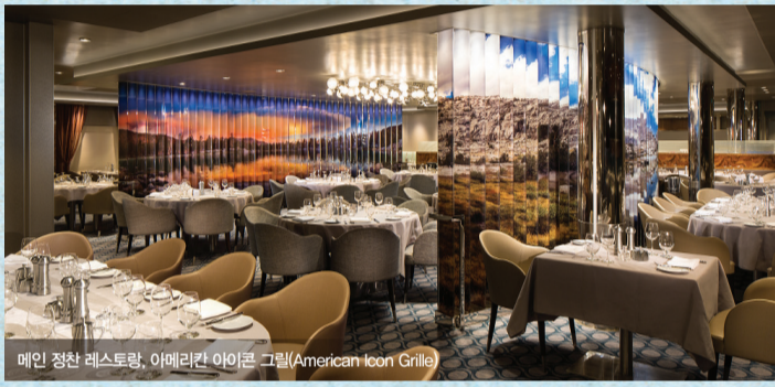
메인 정찬 레스토랑, 아메리칸 아이콘 그릴(American Icon Grille)

■ 아메리칸 아이콘 그릴(American Icon Grille) _ 4층 선미 (Afterward) 뉴올리언즈 스타일의 수프, 뉴잉글랜드 클램 차우더, 남미의 버터밀크 차킨요리 등 아메리칸 스타일의 음식들을 맛보실 수 있습니다.