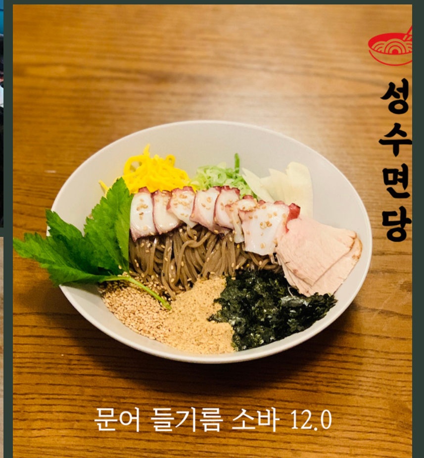
문어 들기름 소바 12.0