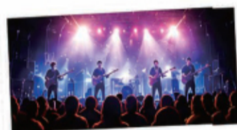
너의 음악을 세상에 들려줘!