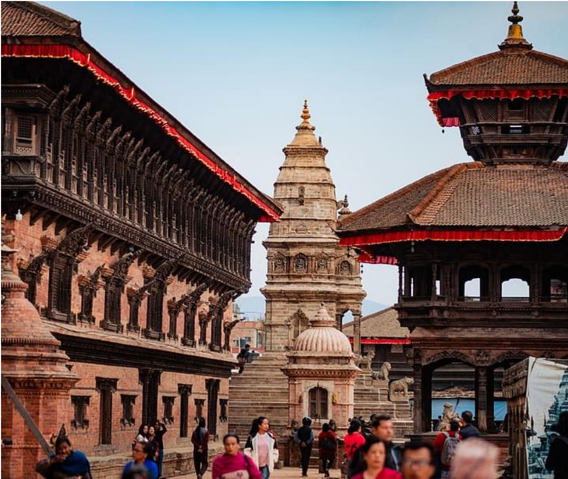
네팔 빠탄 광장