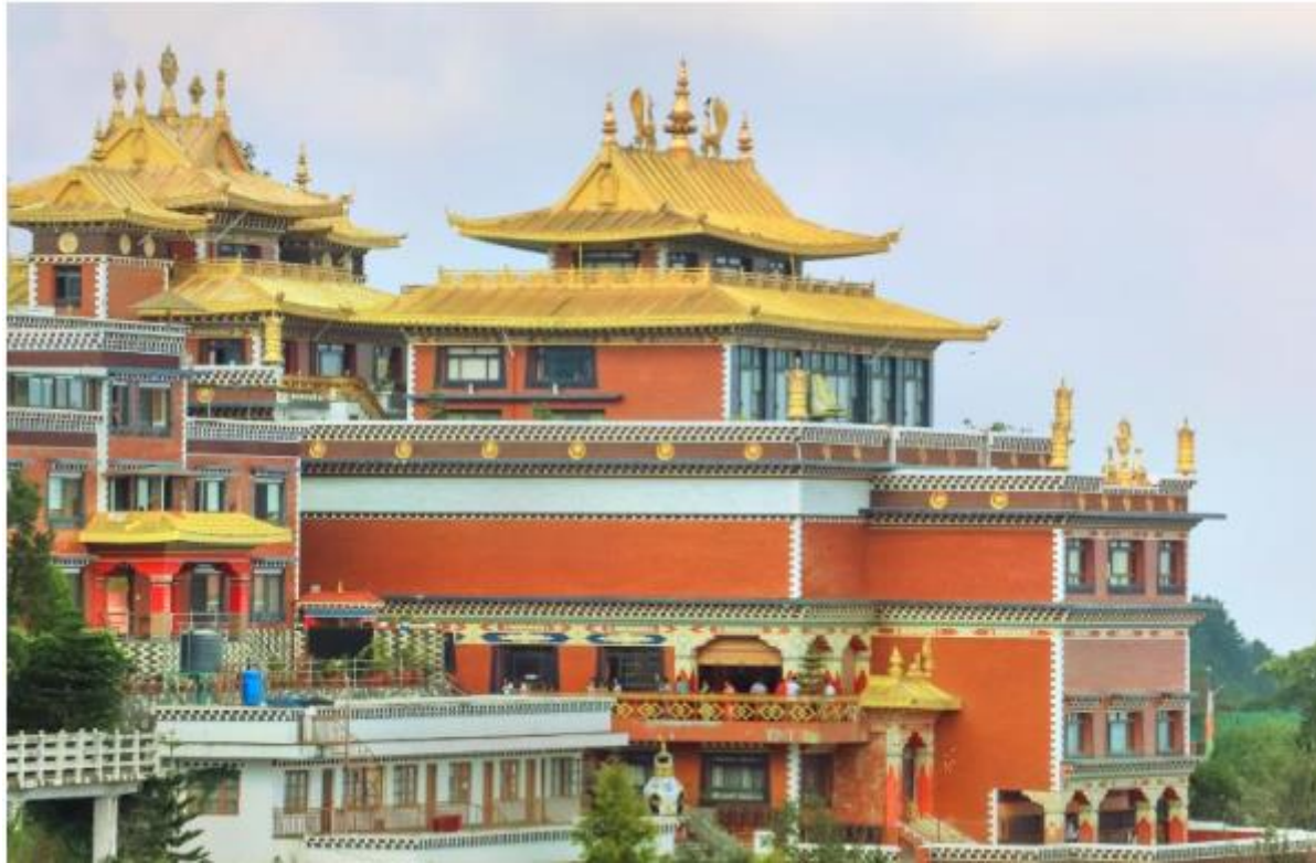
나모붓다 사원 (Namobuddha Monastery)