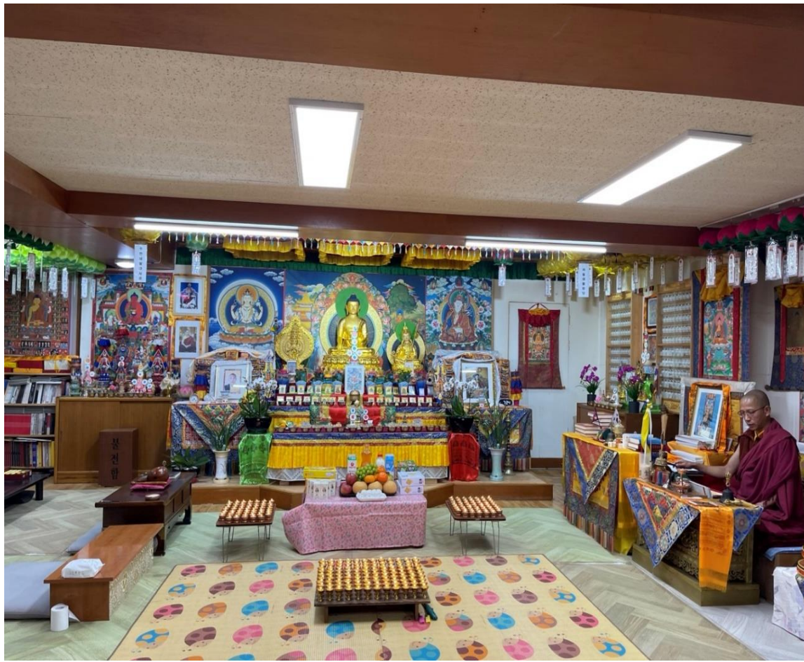
서울네팔 법당(일원동) 꾀상스님 주지