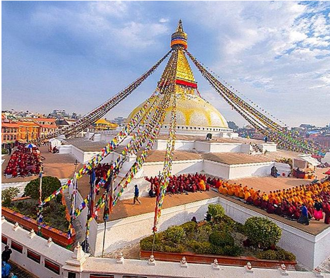
네팔 수도 카트만두 대탑 (바우다나트)