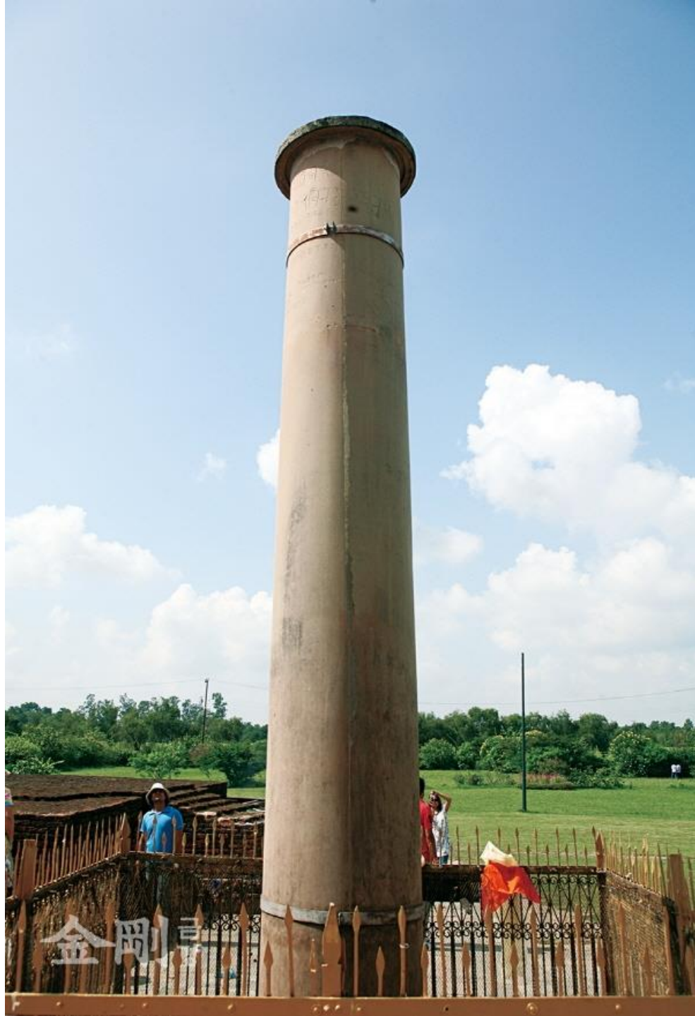
룸비니에 있는 아쇼카왕 석주