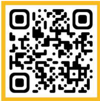
실무연수 20기 신청