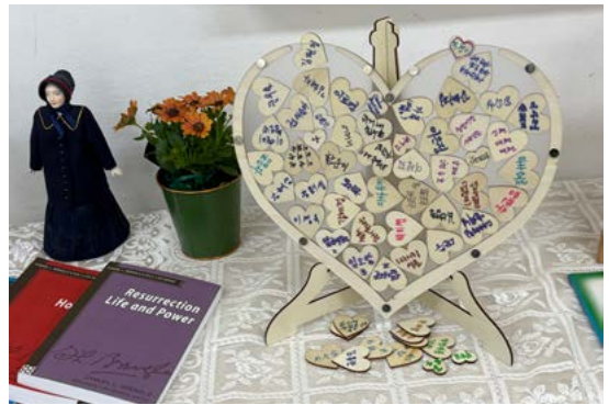
나눔과 적용 활동 1