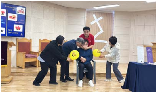
나눔과 적용 활동 2