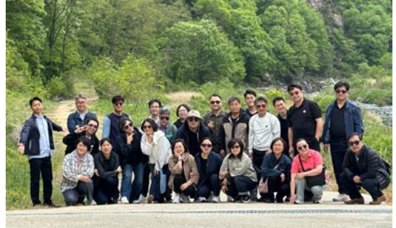
자연 속 묵상