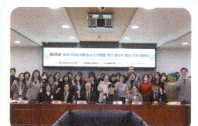
경계선 지능아동을 위한 토론회

글자를 읽기 어려워 힘들어하던 아동도 맞춤형 지도를 통해 작은 성취를 경험하고 기뻐했습니다.