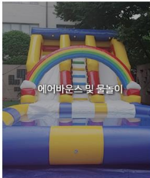
에어바운스 및 물놀이