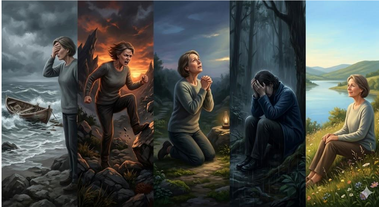
_ Elisabeth Kübler-Ross [죽음의 5단계]