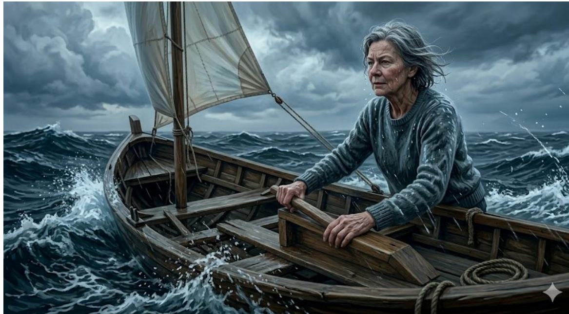
4단계 : 우울