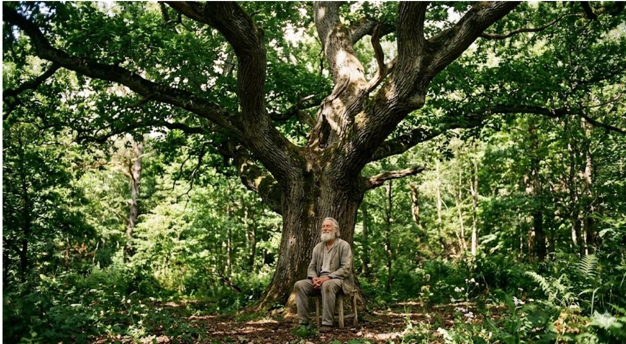
쓸모 없는 거목의 편안함