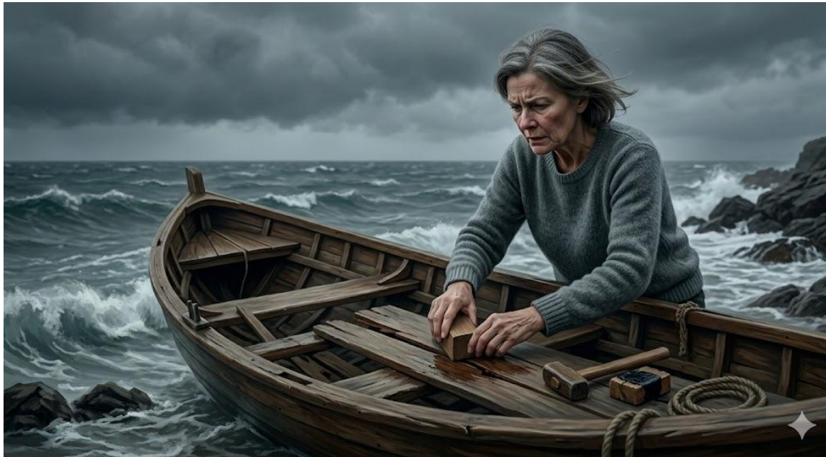
2단계 : 분노