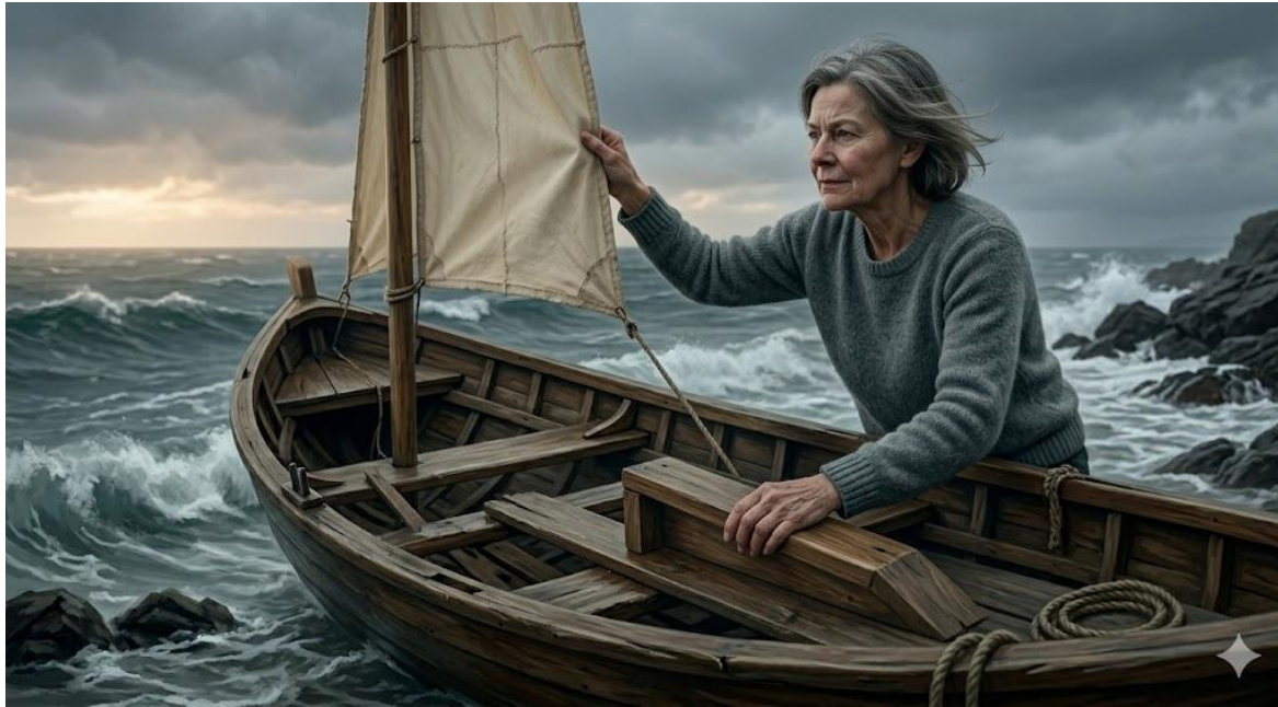
3단계 : 타협