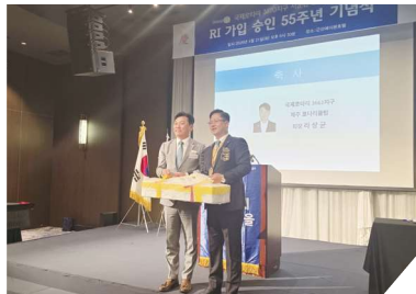
방문 선물 전달