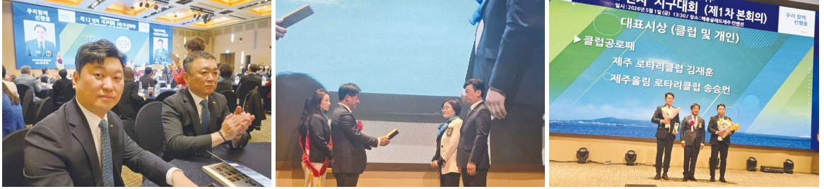
5/1 1차 본회의의 메종클래드 제주호텔

먼길에서도 달려와 1호 클럽의 명분을 지켜주신 회원과 부인회원께 감사합니다.