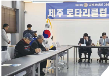
로타리의 목적 및 네가지 표준