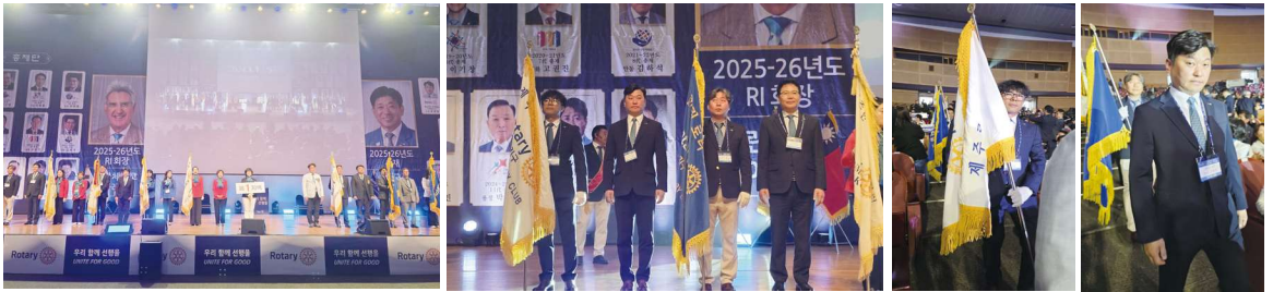
5/2 2,3차 본회의-제주 국제컨벤션 센터