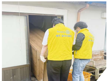
집 사물 이동