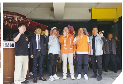
제주 RC회원들과 함께