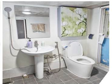
샤워기 시설 추가 & 바닥, 벽 작업