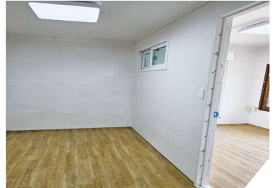
방 2개로 분리(자매 공부방)