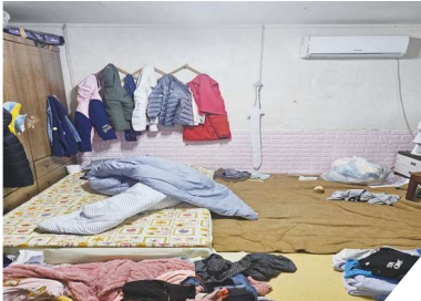
안방 작업 전