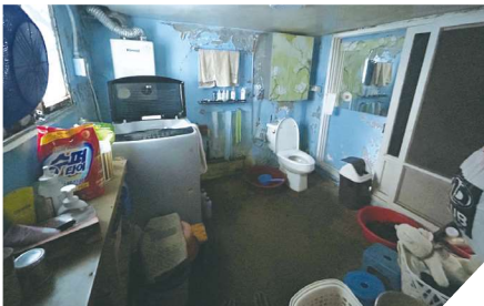
화장실 작업 전