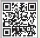
▶담화 원문 보기