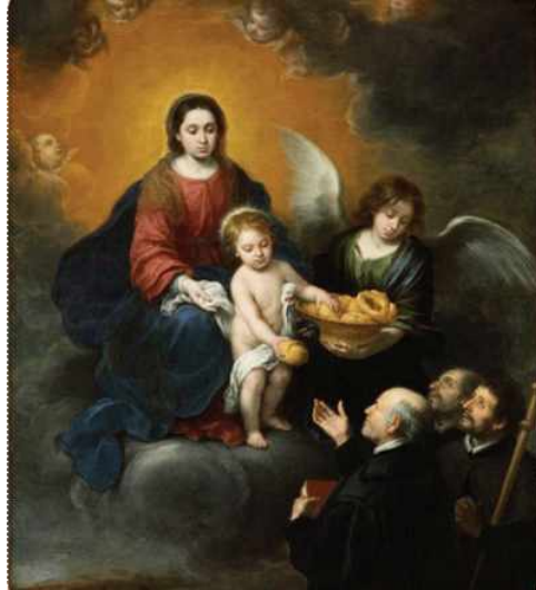
▶바르톨로메 에스테반 무리요 <순례자들에게 빵을 나눠주는 아기예수> 1678년경, 캔버스에 유채 부다페스트 미술관, 헝가리

2026년 6월 7일(가해) 지극히 거룩하신 그리스도의 성체 성혈 대축일