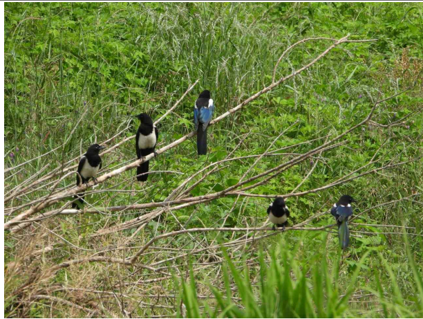
나란히 나란히 까치들