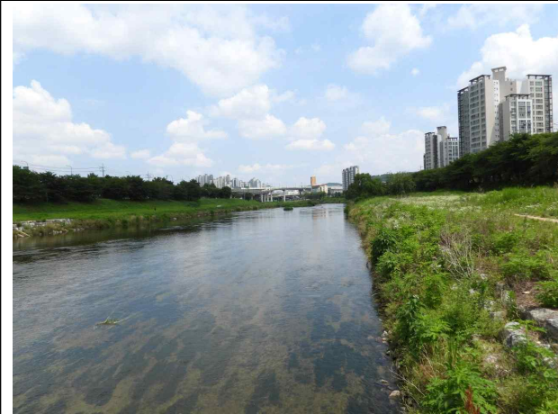
6월의 안양천 전경