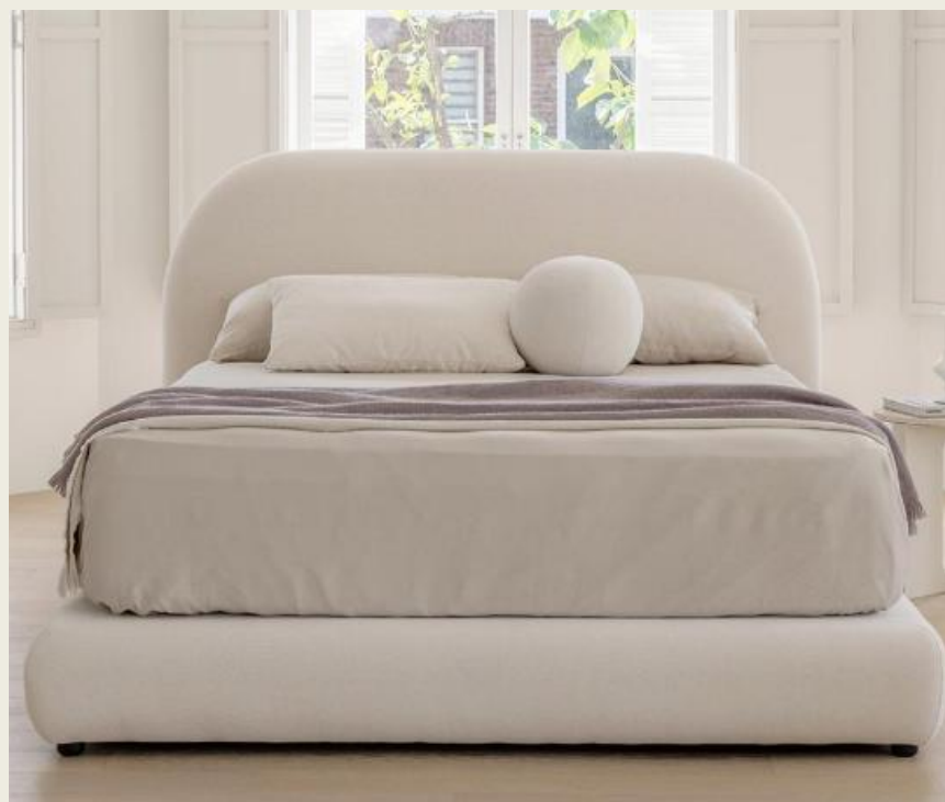
Contemporary Fabric Upholstered Bed Frame King / Cream