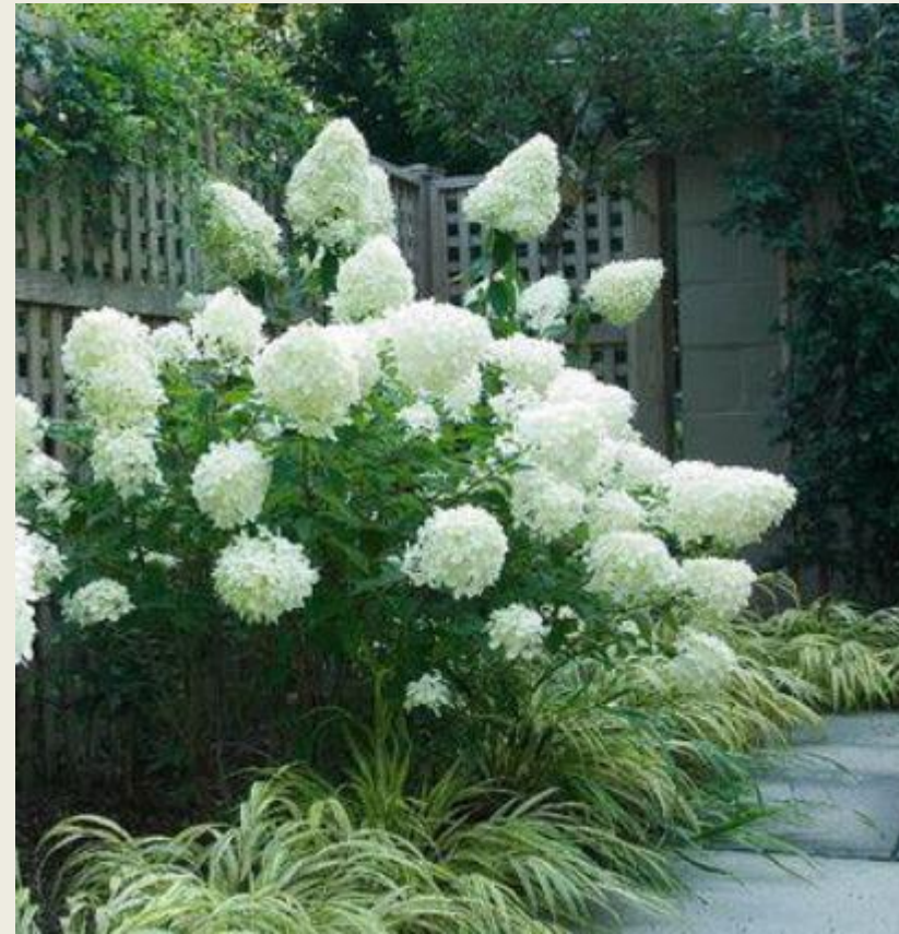
Hydrangea arborescens 'Annabelle'

이곳은 장식용 식물과 휴식 공간이 조화를 이루는 현대적인 프라이빗 마당으로, 미니멀리즘 스타일로 디자인되어 있습니다. 공간은 매우 가볍고 '공기감'이 느껴지며, 녹지가 중심을 이루고 부드러운 자연적인 형태와 중립적인 재료(돌, 나무, 잔디)가 사용되어 있습니다.