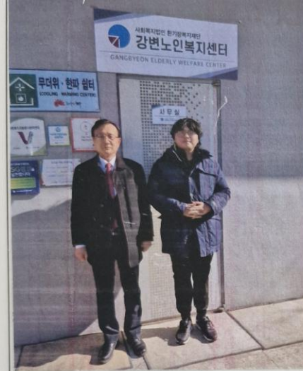
사진설명: 지도교수님 실습 현장 방문