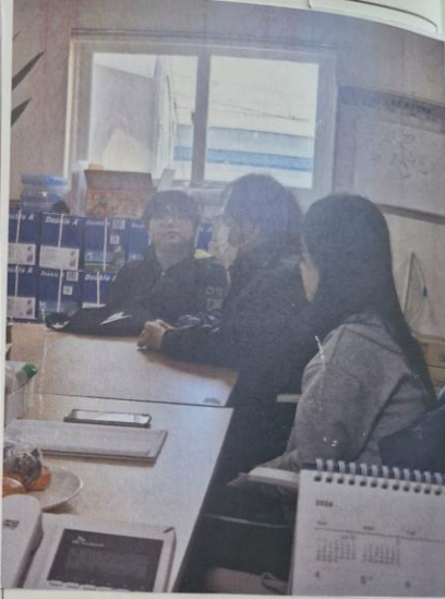
사진설명: 실습성 지도 교육