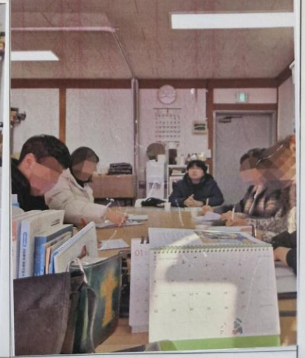
사진설명: 성화지원사 회의 참관