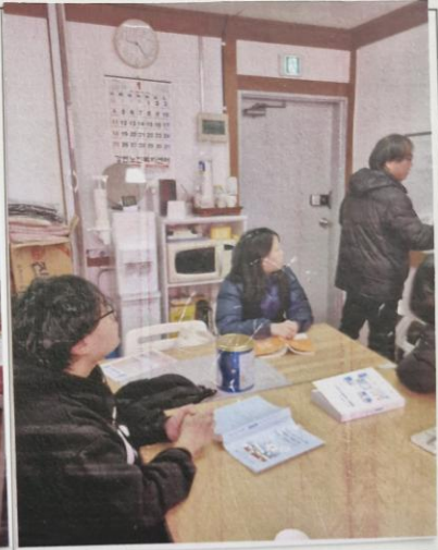
사진설명: 삼습지도자 현장위주 교육