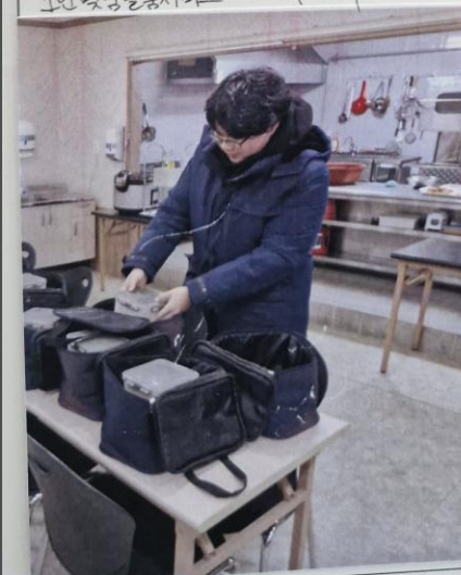
사진설명: 도시락 배달을 위한 도시락 담기