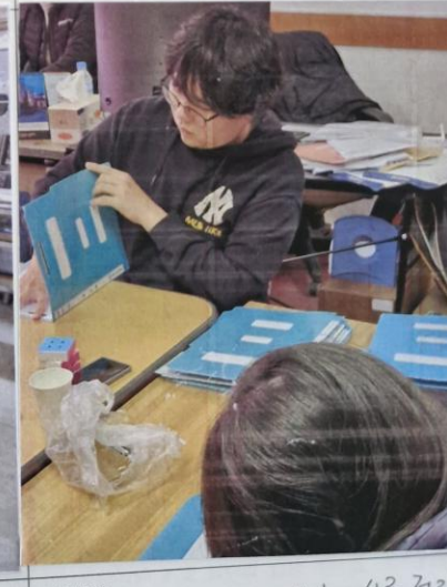
사진설명: 노인맞춤돌봄서비스 대상자 서류 정리