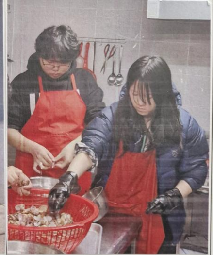
사진설명: 도시락 배달 서비스 식자재 손질