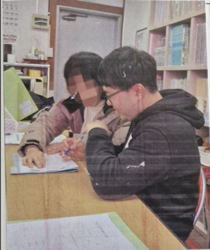
사진설명: 노인맞춤돌봄서비스 서류 정리