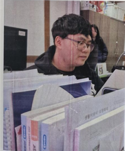
사진설명: 서비스 매상자 서류 정리