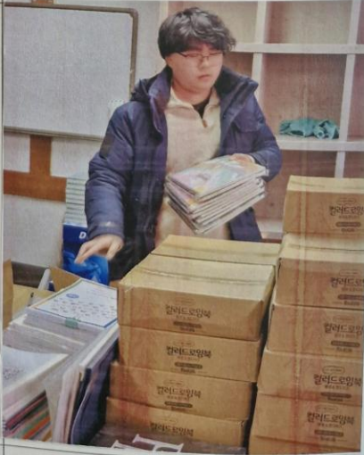
사진설명: 맞춤형봉사 사무원 교육용품정리