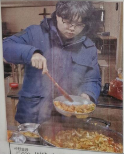
사진설명: 도시락 배달 서비스 도시락 배반