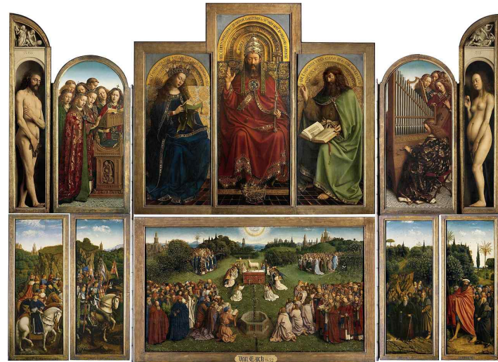
야반 아이크 (1390년 ~ 1441년) 1432년 제작 나무 위 유화 350x461cm 상비보(St. Bovo) 대성당 벨기에 켄트

켄트 제단화는 12개의 패널로 이루어진 매우 복잡한 제단화로, 열려 있을 때와 닫혀 있을 때 각기 다른 메시지를 전달한다. 오늘 주목할 부분은 상단 중앙에 있는 그리스도왕 부분으로, 왕좌에 앉아계신 예수님(혹은 하느님)의 왼쪽(우리가 보기에)에는 성모님이, 오른쪽에는 세례자 요한이 그려져 있다.