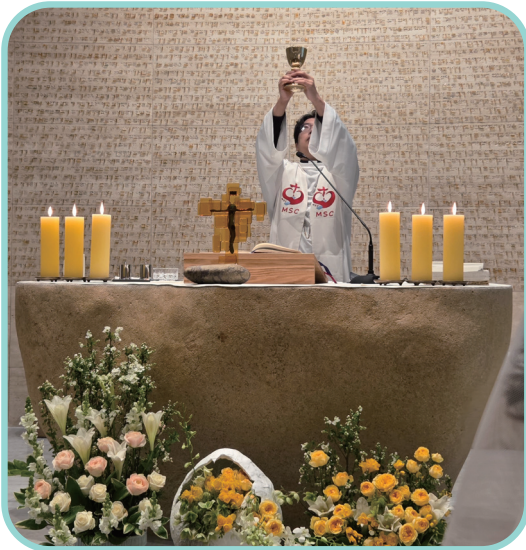
이승훈베드로 기념관 경당에서 미사집전하시는 조인준미카엘 신부님