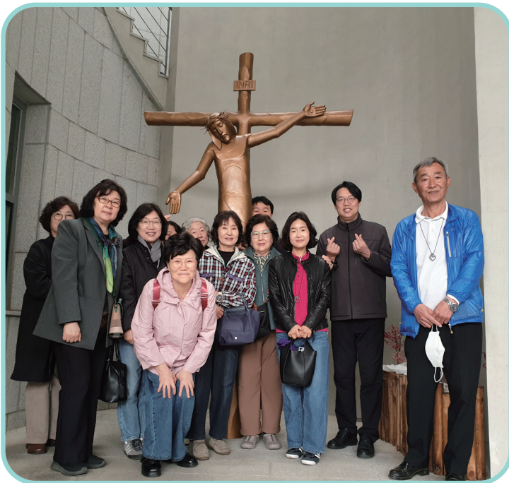
순례의 날 월피정(2026.4.6.) 자비와 사랑의 손을 내밀고 계신 위로의 예수님과 함께 장소: 이승훈 베드로 순교 성지 기념관