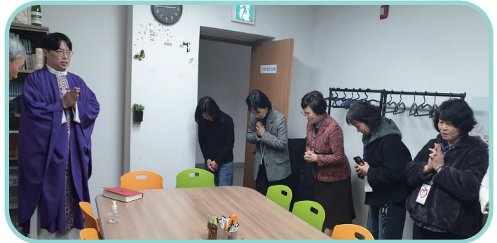
친교회 방을 꾸미고 청소한 후, 신부님께서 축복해 주셨습니다. 2026.3.2.(월)