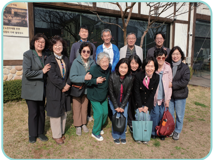
순례의 날 월피정(2026.4.6.) 성지 기념관 순례 후 친교의 시간을 가진 카페 앞에서