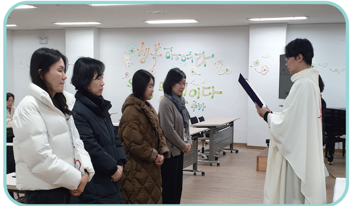
2026.2.2. 임명장 수여