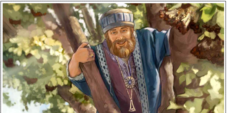
삭개오는 로마 제국을 위해 세금을 걷는 세리였으며, 심지어 세리들을 관리하는 세리장이었습니다. 당시 세리들은 로마 정부가 정한 것보다 더 많은 세금을 걷어 착복하는 경우가 많아, 동족인 유대인들로부터 '죄인' 취급을 받으며 따돌림을 당했습니다. 키가 작았던 삭개오는 예수님께서 여리고를 지나가신다는 소식을 듣고, 사람들이 많아 예수님을 볼 수 없자 앞으로 달려가 뽕나무(돌무화과나무) 위로 올라갔습니다.