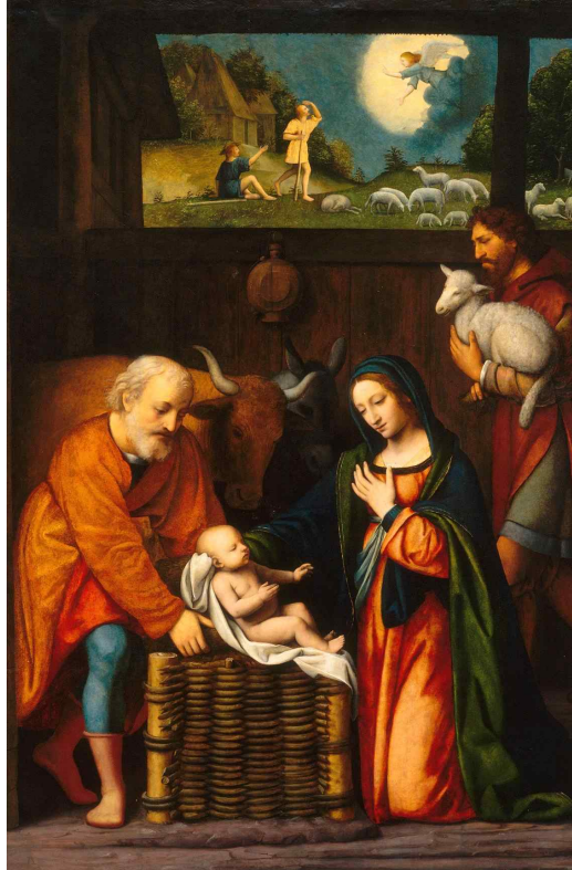
Bernardino Luini, "Adoration of the Christ Child and Annunciation to the Shepherds"