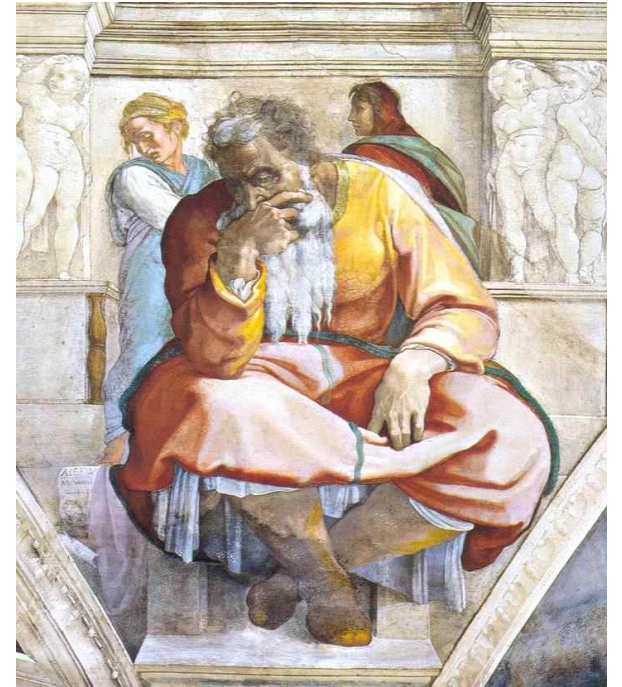
미켈란젤로, "예레미야", 시스티나 성당 천정화