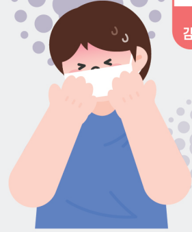
24-25년 충북 백일해 신고 현황