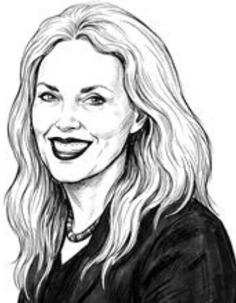
그림2. 엘레인 스캐리

인 엘레인 스캐리(Elaine Scarry)[그림 2]의 말처럼, 심한 고통은 기존 언어 체계를 무너뜨린다. 부연하면, 자신의 통증을 제대로 표현할 수 있는 능력을 깨뜨려버린다. 성격·직업·생활환경·삶의 이력, 때론 독서(讀書)를 통한 간접 체험 등에 따라, 매우 다양한 은유를 동원하여 통증을 표현한다. ‘칼로 베는 듯한’ ‘타는 듯한’ ‘천근만근 같은’.... 이러한 은유적 장치를 파악하고 이해하는 것은 의사가 질병의 본질을 더욱 정확하게 파악하는 데 현저한 도움이 된다.