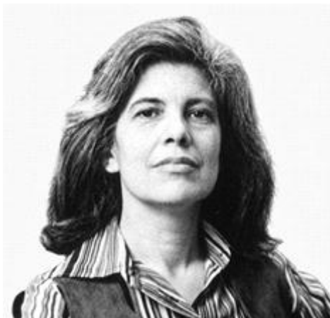
그림 3. 수전 손택 : 수전 손택 1979 ©린 길버트.jpg CC BY-SA 4.0