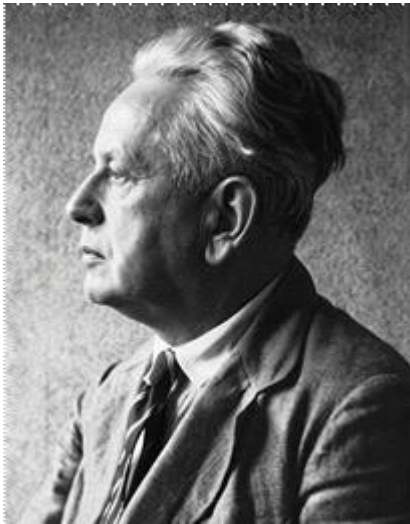
그림 1. 에른스트 카시러

“인간은 물리적 사실 세계가 아니라, 상징을 통해 구축된 의미의 세계에 살고 있다.”라는 독일 철학자 에른스트 카시러(Ernst Cassirer, 1874~1945)[그림 1]의 ‘상징적 우주’를 인용한다.