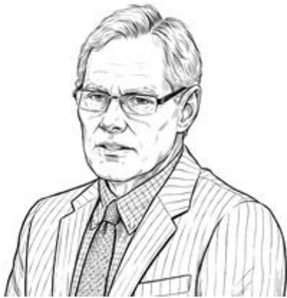
그림 6. 아서 프랭크

『아픈 몸을 살다』의 저자인 미국의 사회학자 아서 프랭크(Arthur Frank, 1946~ ) [그림 6]는 질병의 경험이 항상 프라이탁식의 깔끔한 피라미드 구조를 따르지 않는다는 점을 지적하며 세 가지 서사 유형을 제시했다.