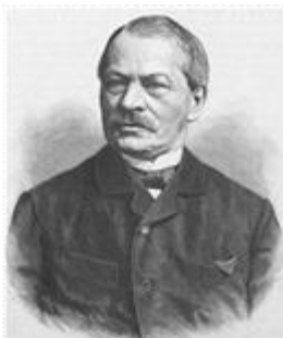
그림 4. 구스타프 프라이탁

의학적 진단 과정은 고전적인 극의 프라이탁의 피라미드 구조를 반영한다. 둘 다 긴장과 해소의 궤적을 따른다. 프라이탁 피라미드 구조는 독일 소설가 구스타프 프라이탁(Gustav Freytag, 1816~1895)[그림 4]이, 소설가들이 수천 년 동안 사용해 온 구조를 설명하려고 이 서사 피라미드를 개발했다. 프라이탁의 피라미드는 이야기의 다섯 가지 핵심 단계를 설명하며, 이야기를 처음부터 끝까지 쓰는 데 필요한 개념적 틀을 제공한다.