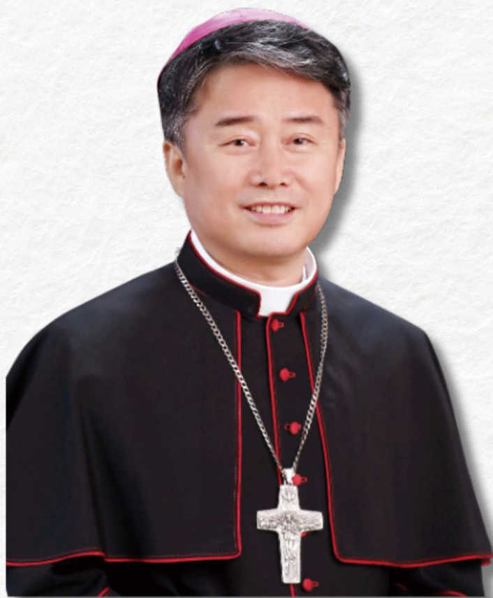
김종강 시몬 대주교

영성체송 너희가 하느님의 자녀이기에 하느님이 당신 아드님의 영을 너희 마음에 보내셨다. 그 영이 “아빠! 아버지!” 하고 외치신다.