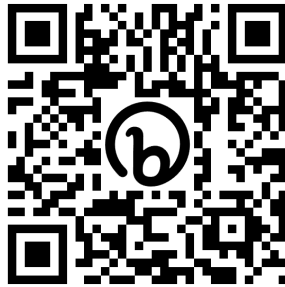
[그림 4] 신청 링크