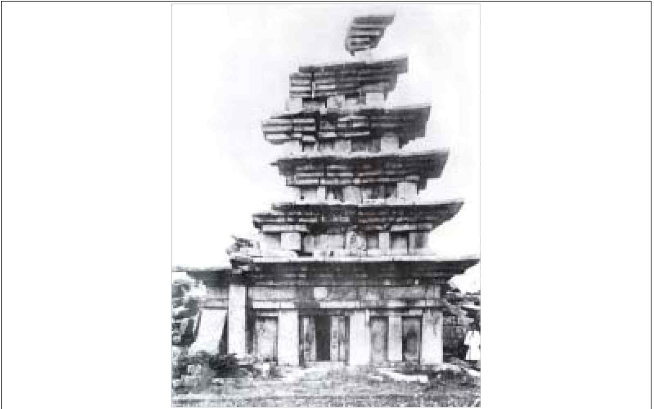
<그림> 1910년대 미륵사지 서탑 5)