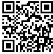
우월한 국어 이유진 카페