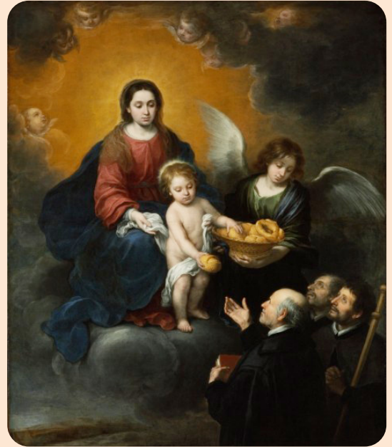
바르톨로메 에스테반 무리요 <순례자들에게 빵을 나눠주는 아기 예수> 1678년경, 캔버스에 유채 부다페스트 미술관, 헝가리