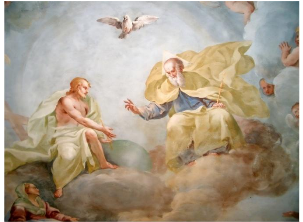
< 루카 로세티의 삼위일체 >

오늘은 지극히 거룩하신 삼위일체 대축일이며 청소년 주일입니다. 그리스도인은 삼위일체 하느님을 믿고 그분께 온전히 의탁합니다. '삼위일체'는 성부와 성자와 성령의 일치와 사랑을 뜻합니다. 삼위일체 하느님에게서 흘러나온 사랑에서 교회는 탄생하였고, 우리는 그 사랑의 힘으로 살아갑니다. 삼위일체의 사랑에 따라 일치와 헌신의 삶을 실천할 것을 다짐하며, 기쁜 마음으로 이 미사에 참여합니다.