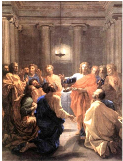
<니콜라 푸생의 영성체의 교육>

오늘은 지극히 거룩하신 그리스도의 성체 성혈 대축일입니다. 예수님께서 우리에게 주신 영원한 생명을 깨닫고 감사하는 날입니다. 예수님께서서는 인간에 대한 지극한 사랑으로 살아 있는 생명의 빵이 되셨습니다. 주님의 몸을 모시는 이 미사에 기쁘게 참여하며 우리도 주님 안에 깊이 머무르는 성체성사의 삶을 살아가기로 다짐합니다.