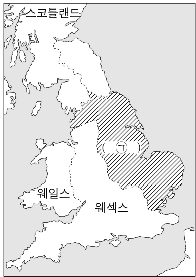
<9세기 후반 브리튼 제도>

(가) 9세기 후반 잉글랜드를 침략한 노르만인은 880년 경 웨섹스의 앨프레드 왕과 평화조약을 맺었다. 당시 웨섹스 왕국의 기록에서는 노르만인이 장악한 지역을 ( ㉠ ) (이)라고 불렀다. 이후 노르만인은 크리스티교로 개종하여 서서히 앵글로·색슨인과 융화되어 나갔다.