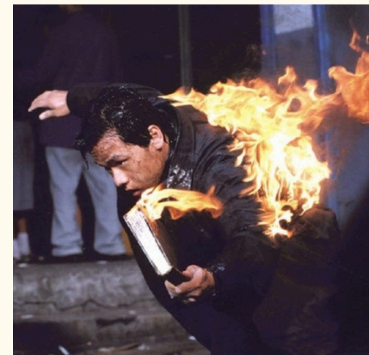
'아름다운 청년 전태일' 극영화