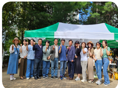
2025. 온 마을이 자원순환 캠프 축제 운영위원

올해가 시작된 지 벌써 6월입니다. 그동안 열심히 달려오느라 지치긴 했습니다. 이제 밀린 소식지를 열심히 만들어서 다시 띄워보려고 합니다. 언제나 여러분의 따뜻한 손길과 관심에 늘 감사한 마음을 갖고 있습니다. 옆에서 자리를 늘 지켜주시고, 힘을 보태주셔서 감사합니다^^