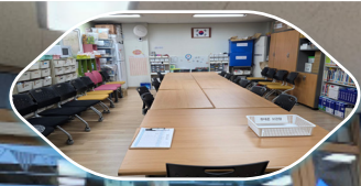
제3자료실 (상사돌봄, 동아리, 등)

04 꿈26년 지원사업 현황 꿈마루도서관이 걸어 온 길 CMS 정기후원자 문의사항