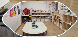
제2자료실 (어린이작업실 모야)

2. 책으로 하나 되는 마을 책과 책문화 사업을 통해 이상과 삶의 질을 높이고, 함께 살며 함께 아이를 키우는 그런 하나 된 마을이 되길 힘쓰고 있습니다.