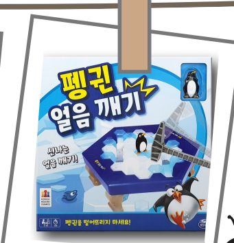
펭귄 얼음 깨기