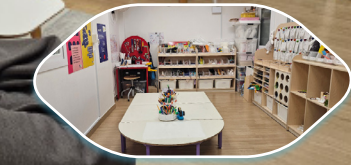
제 2 자료실 (어린이작업실 모야)

2. 책으로 하나 되는 마을 책과 책문화 사업을 통해 이상과 삶의 질을 높이고, 함께 살며 함께 아이를 키우는 그런 하나 된 마을이 되길 힘쓰고 있습니다.