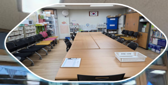
제 3 자료실 (상시돌봄, 동아리, 등)