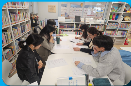
4월 운영위원회의 (4월 21일)