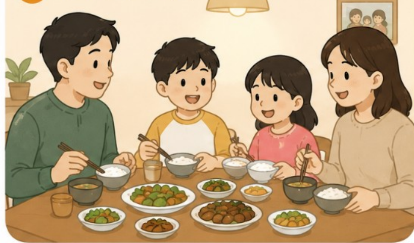
3 가족과 저녁 먹기