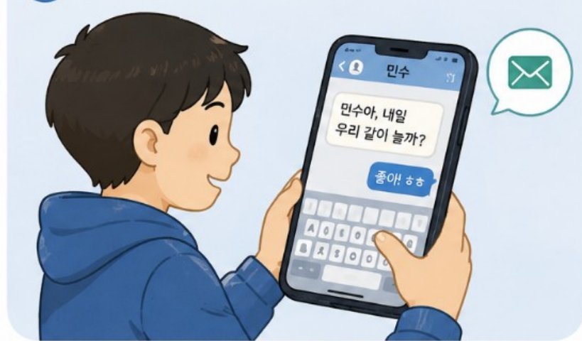
1 친구에게 문자 보내기