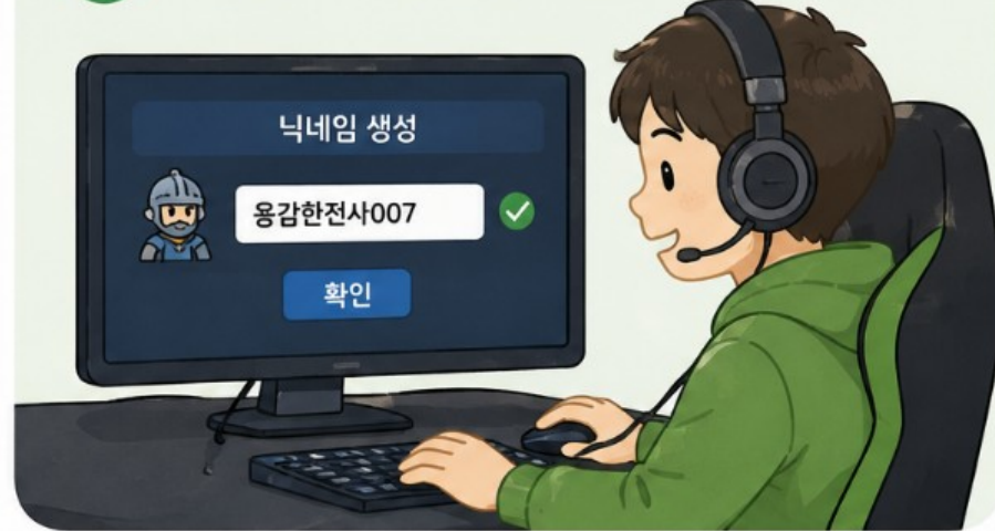
2 게임할 때 쓰는 별명 만들기