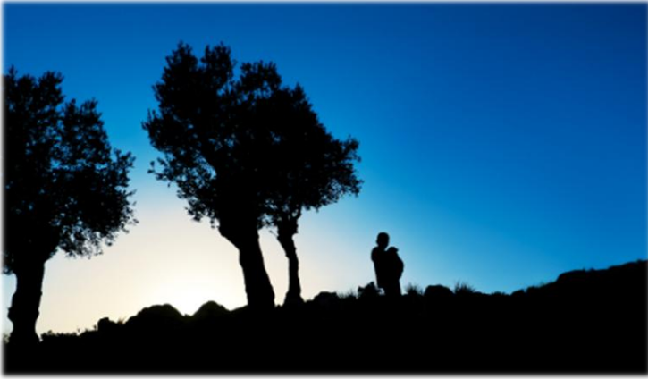
Jordan, 2008 (사진, 글 by 박노해 가스파르 시인)