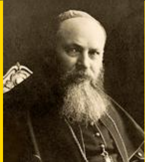
보니파시오 사우어 주교 아빠스