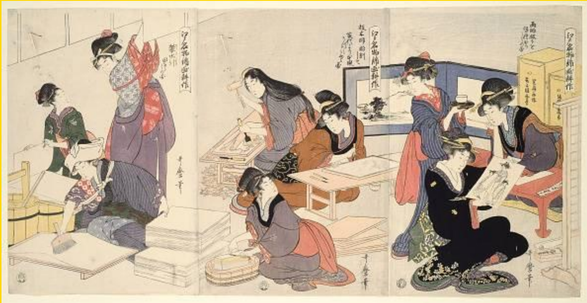
錦絵(にしきえ) 喜多川歌麿(きたがわうたま) 에도의 유명한 비단 그림 농사