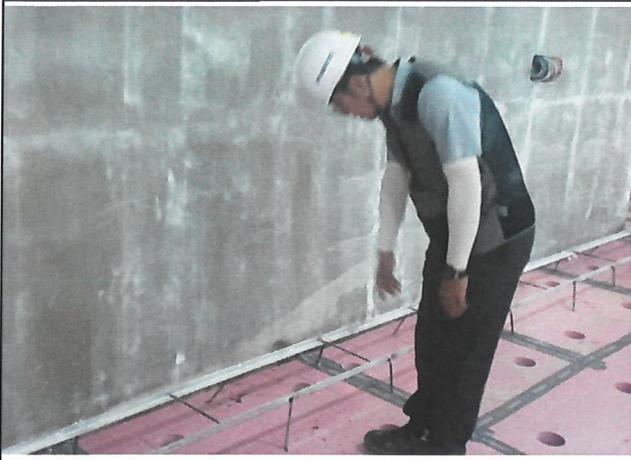
현장 점검(단열배수판 상부위 용접금지)