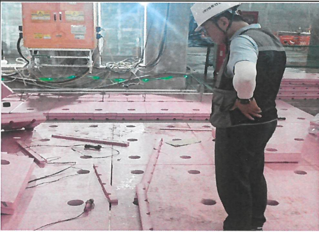
현장 점검(절단기 점검)