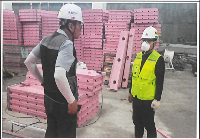
현장 점검(절단기 사용시 장갑 교체-완코팅장갑)