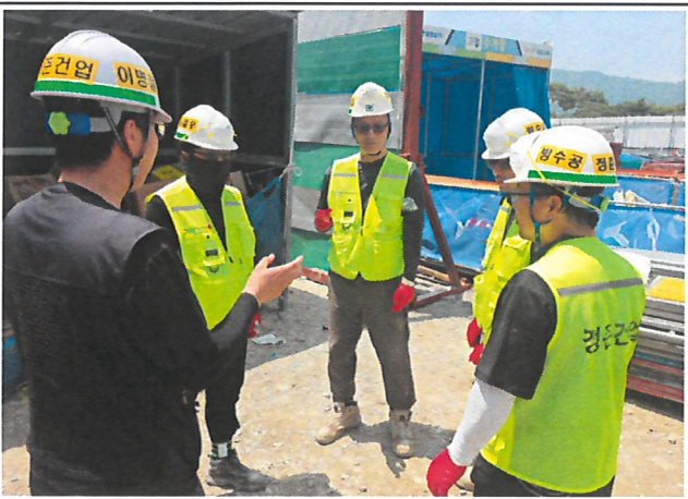
TBM시 완전코팅장갑 착용 및 교육