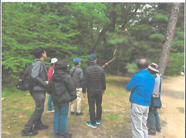
[사진4. 릉에서 소나무의 의미 및 상징]