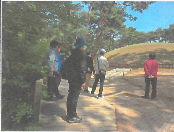
[사진1. 선릉에 대한 설명]