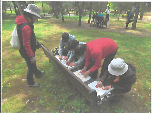
[사진2. 천연염색 프로그램]