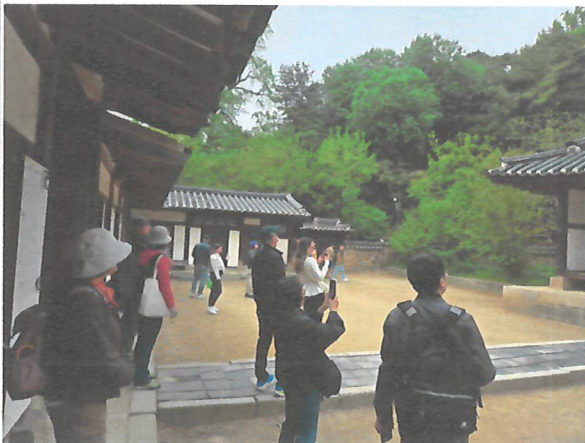
[사진3. 재실 탐방 및 설명]