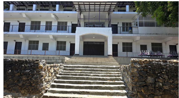
교육관 앞 계단 공사 완성