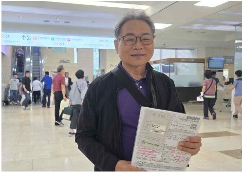
좋은 검사 결과를 받고

2026년 5월 18일(토) 우리 내외는 한국의 병원 정기 검사를 받기 위해 6개월 만에 다시 한국에 들어갔다. 이번에는 혈액과 소변검사 그리고 뼈 골밀도 검사 등 간단한 검사만 받았다. 일주일 후에 검사 결과를 보기 위해 병원을 찾아가면서 우리 내외는 “이번에도 좋은 결과를 주셔서 필리핀에서의 선교 사역을 계속할 수 있게 해달라” 는 기도를 하나님께 올렸다. 결과, 담당 교수는 모든 수치가 다 양호하니 다시 6개월 후에 보자고 하며 다음번에는 좀 더 세밀한 검사를 진행하겠다고 했다. 우리 내외는 좋은 검사 결과를 주신 하나님께 감사를 올려드리고 약해진 체력 강화를 위해 두 내외 모두 비타민 링거 주사를 맞고 필리핀으로 다시 돌아왔다.