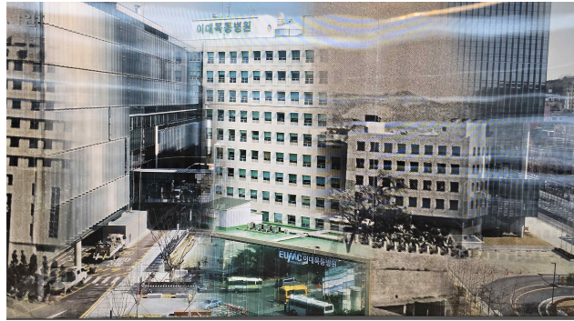
정기 검진 이대목동병원