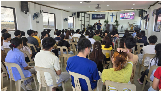
전 제자 멤버십 트레이닝

필리핀에 무더위가 찾아오고 학생들은 긴 여름방학을 보내고 있다. 대부분의 교회들은 어린이 여름성경학교를 개최하여 행사로 마쳤지만 우리 DMC는 여름성경학교를 통해 새로운 어린이 제자 물색을 위한 작업에 착수하게 된다. 한 달이 지난 지금 약 20명 정도의 어린이들이 남아서 열두 번째의 제자 선택을 기다리고 있는데 두 달간의 테스트를 통해 6월 중에 새로운 제자 선택이 이루어지는 것이다. 한편 5월 1일(금)은 노동절 공휴일로 1박 2일간 멤버십 트레이닝이 가능하다는 생각에 전 제자들을 소집하여 A, B, C 전체 3개 그룹 멤버십 훈련을 진행했다. 평소 제자들의 연령별 그룹 교제는 원활하지만 연령대가 다른 그룹간의 멤버십은 이런 기회가 아니면 이루어지기가 어렵기 때문이다. 전체 강의와 그룹별 창작발표 그리고 게임들이 진행되면서 제자들은 자연스럽게 나이와 그룹을 초월하여 하나가 된다. 그러므로서 동생들은 형들을 의지하고 언니들은 동생 제자들을 아끼고 사랑하는 마음을 갖게 된다.