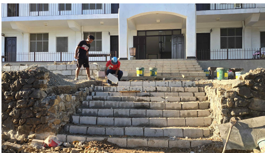
계단 하나하나 설치하고