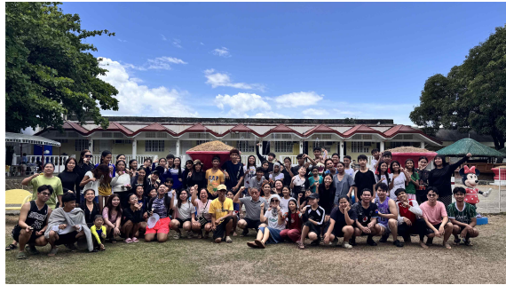
무더위 속 근처 수영장에서 즐거운 한때를 보내고 있다

교회에서 하룻밤을 함께 지낸 제자들은 다음날 토요일 아침, 주일 예배 준비를 위한 교회 대청소를 하고 다 같이 근처 수영장으로 향했다. 즐거운 비명과 함께 물속에서 마음껏 뛰어노는 제자들을 바라보니 보는 사람의 마음까지도 흐뭇하다. 평소 마음껏 이런 즐거움을 누릴 수 없었던 제자들에게 이와 같은 특별한 시간을 만들어 줄 수 있는 것 역시 한국에서 보내주는 후원자들의 도움이 아니고서는 불가능하기에 다시 한번 여러 후원자님들에게 감사를 전한다.