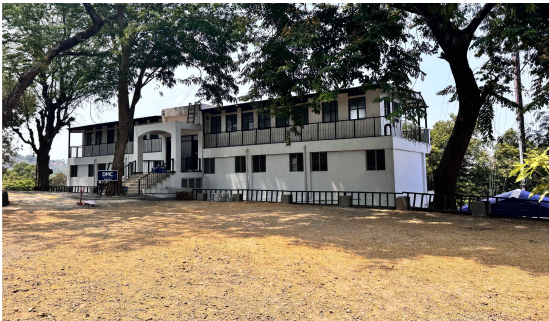
이날 선교센터에 꽃비가 내렸다

2026년도 4월과 5월에 걸쳐 약 40일간 실시된 PCK 총회 파송 선교사 훈련이 끝났다. 이번 선교사 훈련에는 우리 필리핀 제일선교회에서 추천해 준 조현제 양현숙 선교사가 포함되어 있는데 이들은 훈련을 마친 다음날 5월 16일(금) 바로 필리핀으로 들어와서 우리 제일선교회 임원들을 찾아 감사 인사를 했다. 그리고 앞으로 두 내외가 거처할 집을 알아보고 또한 사역할 장소인 ‘마닐라 한국 아카데미’ 에도 찾아가서 인사를 드렸다. 신입 선교사 두 내외는 이번에 선임을 맡게 된 김종현 선교사의 안내를 받아 우리 비낭오난 선교센터를 방문했는데 신입 선교사가 훈련을 마치고 먼저 선교회 회장에게 찾아와 인사한 일도 드물거니와 파송 받기 전 현지를 답사하여 자세한 내용을 파악해 보려는 자세가 너무나도 좋게 보였다. 그들은 우리 선교센터의 잘 정리된 역사관을 관람한 후 앞으로 필리핀 선교사 생활을 시작하면서 선교 기록을 꼼꼼히 남겨보겠다는 결심을 남기고 한국으로 귀국했다. 그들은 한국의 제주 중문교회가 창립 111주년을 맞이하여 파송하는 첫 번째 선교사라고 한다.