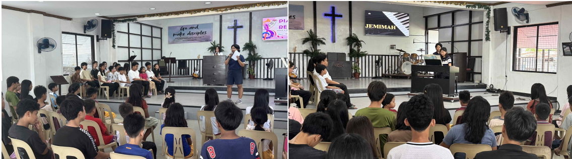
주니어 제자 피아노 발표회