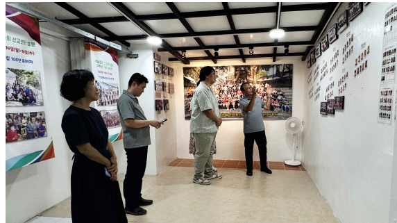
선교센터 역사관 관람