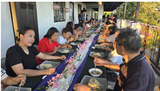
저녁 식사에 초대하여 위로