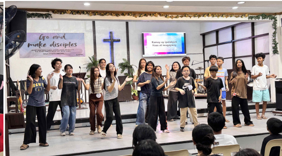
그룹 활동을 통한 단합훈련