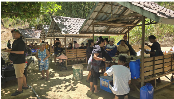
성인 그룹 단합대회

때를 같이하여 DMC의 성인 그룹도 멤버쉽 강화를 위해 음식과 프로그램을 준비하여 야외로 나갔다. 지프니 2대를 렌트해 주겠다는 말에 용기를 얻었는지 꽤 많은 멤버들이 참석하여 즐거운 한때를 보냈다. 워낙 더운 날씨라서 야외 활동이 원활하지는 못했지만 그래도 각자 만들어 가지고 온 음식들을 나누고 물속에 들어가 어린아이들처럼 장난치며 즐거운 한때를 보냈다. 대부분 우리 제자들의 부모들로서 이들은 어려운 시대에 태어나 너무나 가난하게 살아왔기에 공부를 많이 할 수 없었다. 그래서 그들은 자녀들 세대처럼 지식적으로 그룹을 리드해 가지는 못하지만 주일 예배 때마다 좋은 신앙의 모습을 보여주고 봉사 활동에도 모범을 보여줌으로 DMC 한 그룹으로서의 역할을 잘 감당해 주고 있다.