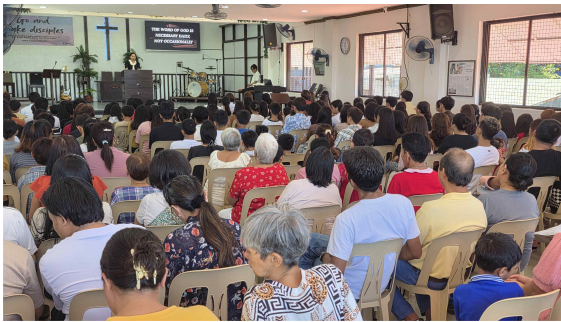
어머니 주일 예배

한국교회는 5월 첫 주일은 어린이 주일로, 5월 둘째 주일은 아버지 주일로 지정하여 지키고 있다. 그러나 먼 과거에는 5월 8일이 어머니 날, 그래서 어머니 주일이었던 것을 부모 공경 형평성에 맞지 않는다고 해서 당시 정부가 아버지날로 고쳤고 또한 아버지 주일로 바뀌었다. 하지만 필리핀에는 5월에는 어머니 주일, 그리고 6월에는 아버지 주일로 나누어 지키고 있다. 우리 제자들은 어머니들 모르게 몇 주 전부터 비밀리에 꽃과 선물을 준비하고 있었는데 5월 둘째 주일이 되자 모든 어머니들을 강단 앞으로 모셔 그동안 열심히 준비하여 만든 꽃을 달아드리고 감사 메시지를 전하는 등 감동적인 시간을 연출했다. 그리고 그것으로 끝나지 않고 저녁 시간에 모든 어머니들을 초청하여 전망 좋은 교육관 3층에 저녁 식탁을 준비하여 대접했다. 우리 내외도 제자들에게 불러 나가 함께 그 모임에 참석하여 응송한 대접을 받았다. 이번에는 딸, 사위 내외가 함께 있어 우리 내외 마음이 더욱 편안하고 푸근했다. 제자들은 식사 후 어머니들을 위로하고 손을 들어 축복하는 아름다운 시간을 가졌다. 한편 다음 달 6월에는 아버지 주일이 있다는데 과연 우리 제자들이 이 두 행사를 다 준비해서 치를 수 있을지 그것이 의문이다.