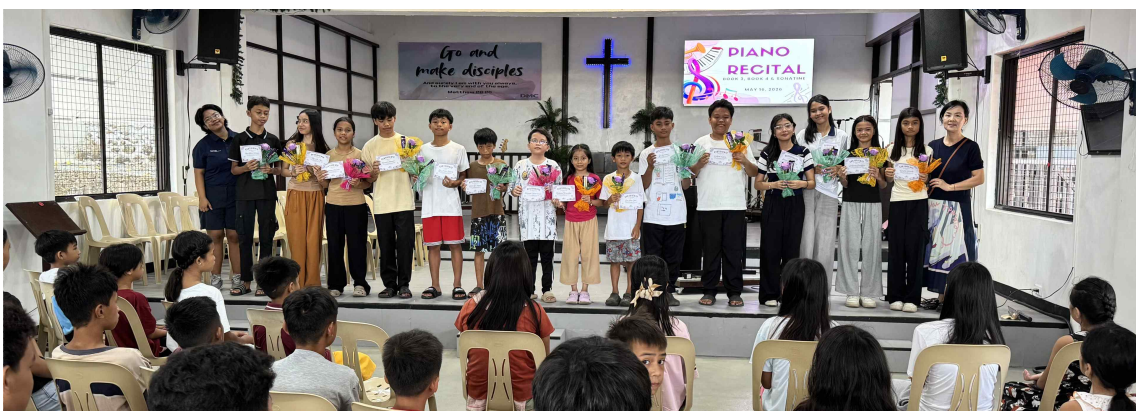
발표자들의 순서가 마쳐지고 격려 순서