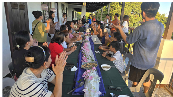
어머니들을 위한 기도