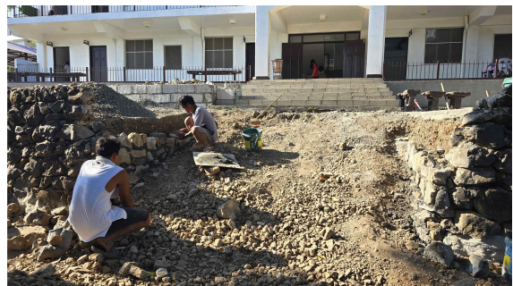
워커들이 축대를 쌓고 있다