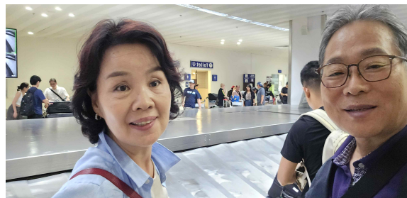
필리핀으로 다시 돌아왔다

필리핀에 돌아온 우리 내외는 하나님께 기도하면서 다음과 같은 비냥오난 선교센터의 미래 계획을 세워 현지인 사역자들과 제자들에게 발표했다.