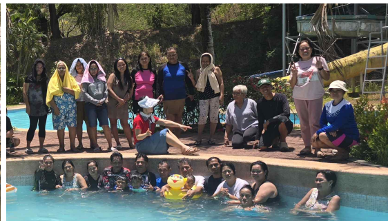
즐거운 물놀이를 잠시 쉬면서