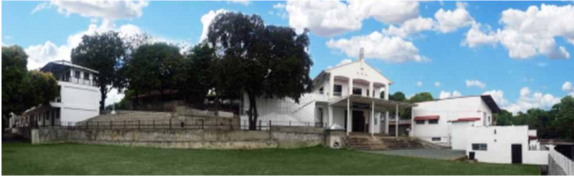
2012년 9월 7일 선교 활동 시작 [필리핀 비낭오난 선교센터 전경]