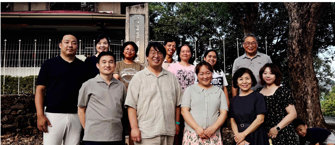
비낭오난 선교센터의 스태프들과 함께 기념사진