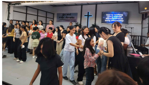
어머니들에게 꽃 증정