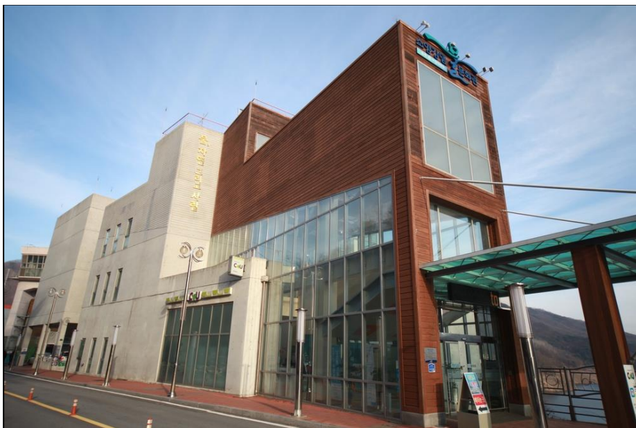
그림2- 소양강댐 물문화관

그러나 소양댐의 완성은 단순히 아름다운 호수가 생겨난 것이 아니다. 댐 건설로 인해 춘천시 북산면과 동면, 양구·인제 일부 등 6개 면 38개 동·리, 약 4,600세대가 삶의 터전을 잃고 수몰되었다. 강물 아래 잠긴 마을의 기억은 여전히 남아있다. 고향을 잃은 수몰민들의 이야기는 춘천의 물이 단순히 아름다운 풍경이 아니라, 누군가의 삶과 기억을 품고 있다는 것을 말해준다. 이처럼 의암호와 소양호를 비롯한 춘천의 물은 도시 정체성을 형성하는 동시에, 그 안에 보이지 않는 역사적 층위를 담고 있는 복합적인 공간이다. 또한 소양강호 주변에 위치한 소양강댐 물문화관에서는 춘천 소양강댐 정상에 위치해 댐의 역사와 수자원의 중요성을 한눈에 배울 수 있는 복합 전시 공간이 있다. 탁 트인 소양호의 절경을 감상하며 다양한 체험형 전시를 함께 즐길 수 있어 나들이 명소로 인기가 많다.