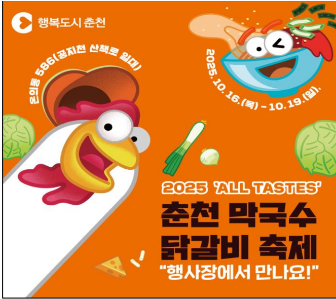
그림5- 춘천 막국수 닭갈비 축제 포스터

막국수는 메밀로 만든 면발을 동치미 국물이나 양념장에 비벼 먹는 음식으로, 그 역사는 임진왜란 이후 인조 시대부터 강원도 지방에서 긴 겨울 밤참으로 애용되어 온 것으로 전해진다. 춘천은 막국수의 만형 격으로, 신복읍 샘밭막국수를 비롯한 여러 유명 막국수 식당이 모여있다. 매년 개최되는 '춘천막국수닭갈비축제'는 이 두 음식의 역사와 문화적 의미를 알리고 지역 경제를 활성화하는 중요한 행사로 자리잡았다.