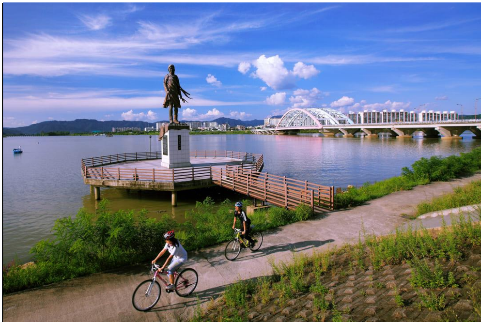
그림1-소양호의 풍경

춘천을 가장 잘 표현하는 말은 단연 '호반의 도시'이다. 춘천 도심 어느 방향에서도 호수나 강이 보이는 이 도시는 자연과 인간의 삶이 매우 긴밀하게 얽혀있는 곳이다. 의암호(衣巖湖)는 1943년 의암댐이 완공되면서 생겨난 인공호수로, 춘천 도심 한가운데를 가르며 흐른다. 면적 약 16km 2 에 이르는 의암호는 단순한 관광자원을 넘어 춘천 시민들의 일상 속에 깊이 자리잡은 공간이다. 호숫가를 따라 산책로와 자전거길이 조성되어 있고, 삼악산호수케이블카가 의암호를 가로질러 삼악산까지 이어지며 도심과 자연을 하나로 연결한다.